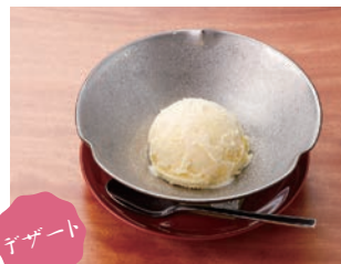
デザート バニラアイス 500円