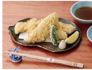
穴子天ぷら盛り合せ 2,900円