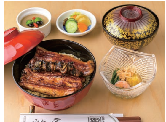
御飯屋うな丼肝のせ