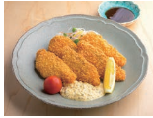
七ツ森サーモンのフライ 1,500円