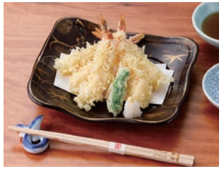
えび天ぷら盛り合せ 2,900円