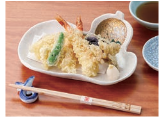
天ぷら盛り合せ 2,300円