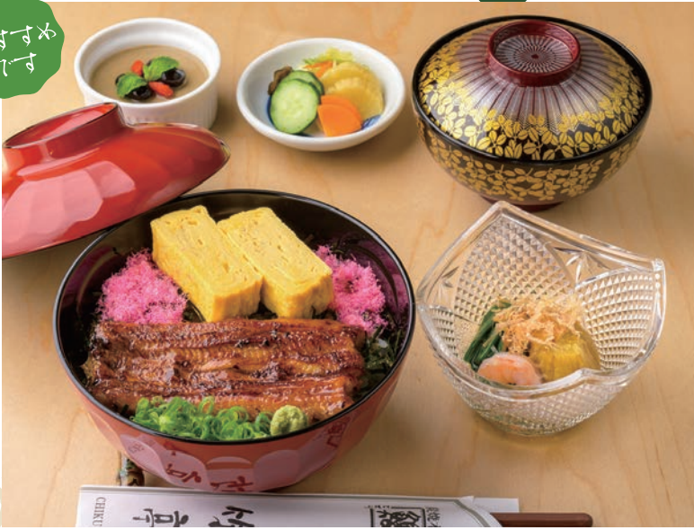
うなぎと玉子焼き丼