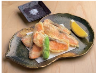
七ツ森サーモンの天ぷら 1,500円