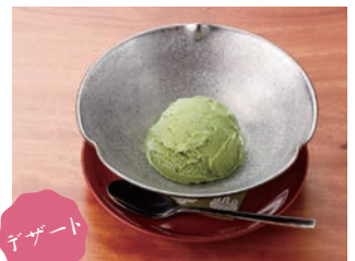
デザート 抹茶アイス 500円