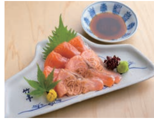
七ツ森サーモンの刺身 1,500円